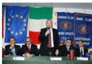
Intervento del Presidente Internazionale Donald Canaday