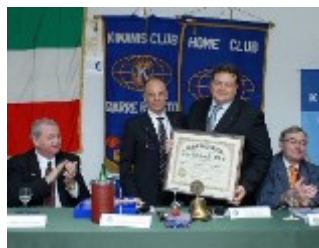
Consegna della Charter