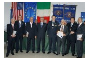
Il Governatore del Distretto Italia S. Marino consegna la Legion d’Onore ai soci fondatori