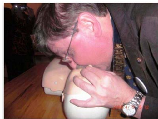
Oskar fa la respirazione bocca a bocca per rivitalizzare il nuovo club

socie una lezione di pronto soccorso e di rianimazione, comprendente la respirazione bocca-bocca su un pupazzo chiamato Pamela in onore del governatore. Il governatore ovviamente avrebbe voluto fare una prova con una assistente in carne e ossa. Vedendo con che professionalità egli ha praticato la tecnica di rianimazione qualcuno ha esclamato che egli era l'uomo giusto per dare un nuovo respiro al Kiwanis in Islanda! Le foto sono della prima riunione del nuovo club di donne e del governatore che dà il respiro al Kiwanis. Complimenti al KC Sólborg per il buon lavoro svolto.