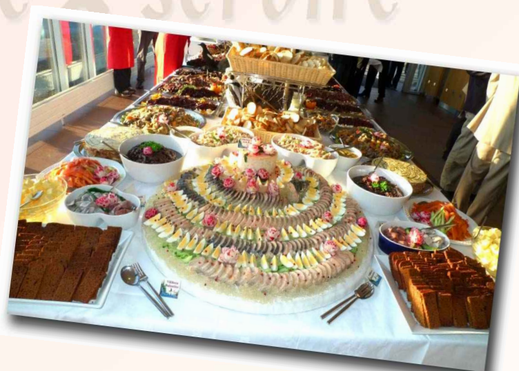
La raccolta doni del club Hraunborg

Filets de Baleine au Wasabi gateau de Saumon au genièvre el poivre Truite fumée à l' ancienne sauce au Raifort Calamar Islandais sauté, Persillade Mousse de Flétan et Saumon en chaud Froid Hareng mariné et épices Fou de bassan légèrement fumés Galantine de Faisan Mousse de lagopède (poule des neiges) Ballotine de saumon Sauvage Paté d'oie sauvage Magret d'oie grise (facon viande des grisons) Magret d'oie grise fumée Huile de noix Macareux seches feuilles de bouleau Mouette eda albatros fumé Macareux en escabèche Terrine de Sanglier